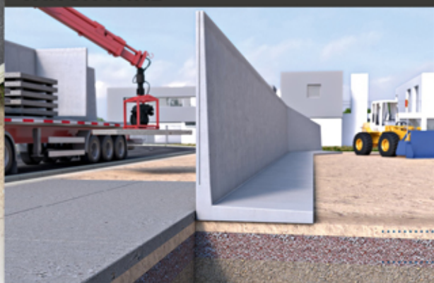
FUNDATIE/GRONDWERK AFHANKELIJK VAN SITUATIE

... Mechanische of hydraulische klem ... Laser gestuurd afkilveren